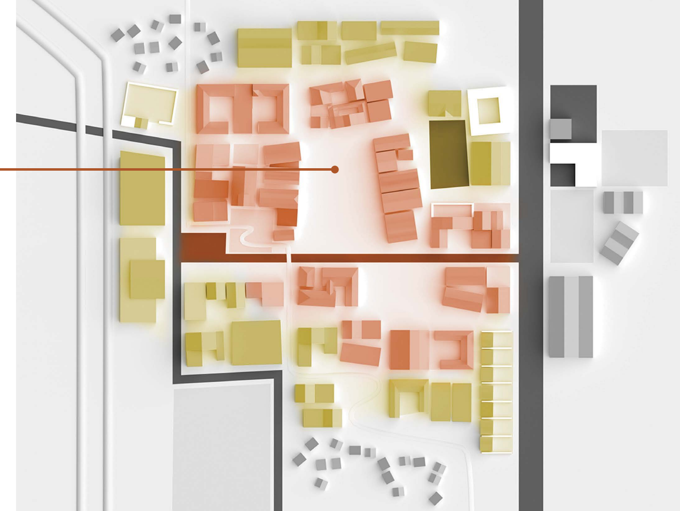
■ Den bestehenden Ortskern stärken. ■ Umgebendes Areal zu Fuß und per Fahrrad an den Ortskern anbinden.

Eine maßgeschneiderte Entwicklungsstrategie für den Orts- oder Stadtkern wird auf Basis des starken Zukunftsbildes erarbeitet. Dafür werden aufeinander abgestimmte kurz-, mittel- und langfristige Einzelprojekte definiert und die Entwicklungsstrategie zum dauerhaften Thema gemacht. Zur Realisierung und flexiblen Adaption der Entwicklungsstrategie werden Strukturen in der Gemeinde aufgebaut und qualifiziert, eine kontinuierliche Kommunikation begleitet den Prozess.