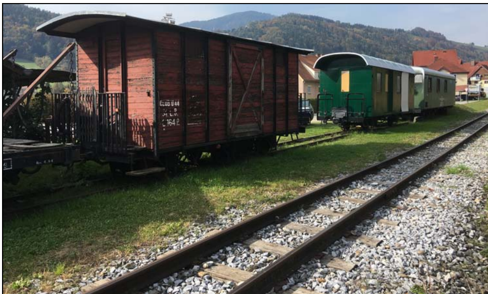
Feistritztalbahn – Bahnhof Anger