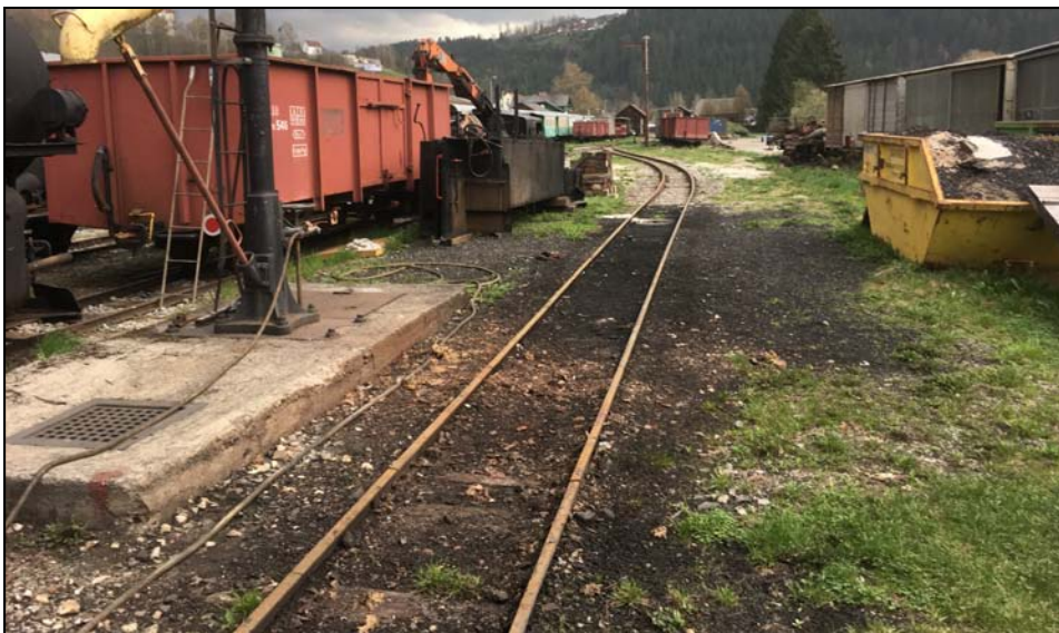
Feistritzalbahnhof – Bahnhof Birkfeld