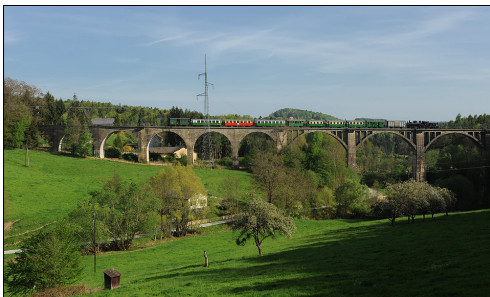
Bosnische/Serbische Eisenbahnen – Sargan-Pass